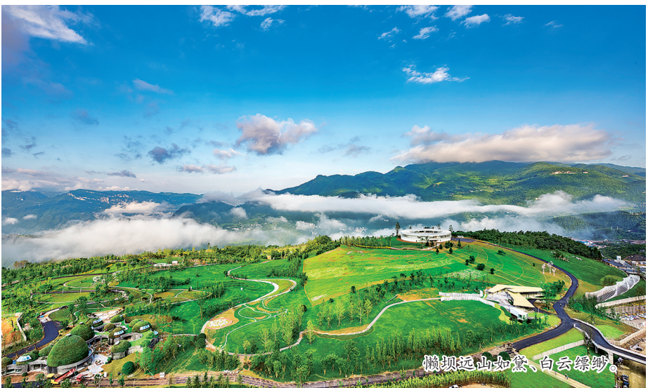
懒坝远山如黛、白云缥缈。