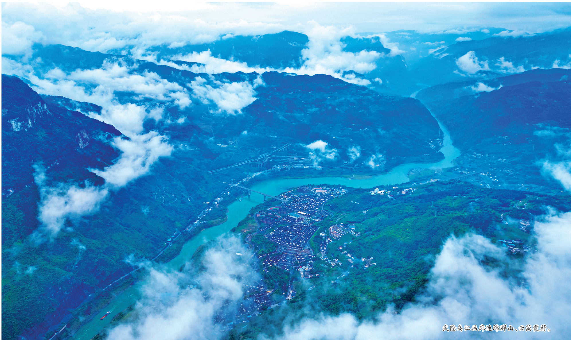
武隆乌江画廊连绵群山、云蒸霞蔚。

日前,由市规划和自然资源局、市地理信息和遥感应用中心推出了《2024重庆观云海地图》,邀请市民在山之巅观如波涛起伏之云海,赏群峰幻化之美景。我区仙女山、白马山、草云山、懒坝风景区、寺院坪五地成功入选该地图。