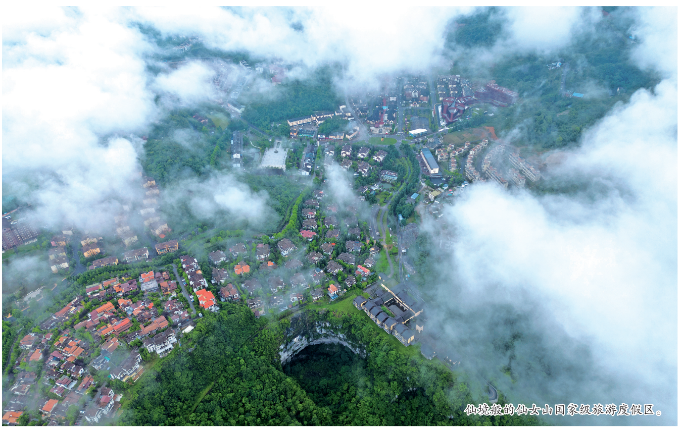
仙境般的仙女山国家级旅游度假区。