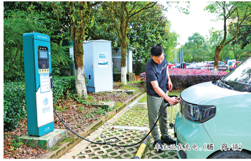
车主正在充电。

据介绍,未来两年,仙女山旅游度假区将分三期在桂花路停车场、仙女山广场、民生燃气旁停车场等地,增设新能源充电桩,进一步为旅居人群出行提供便利。