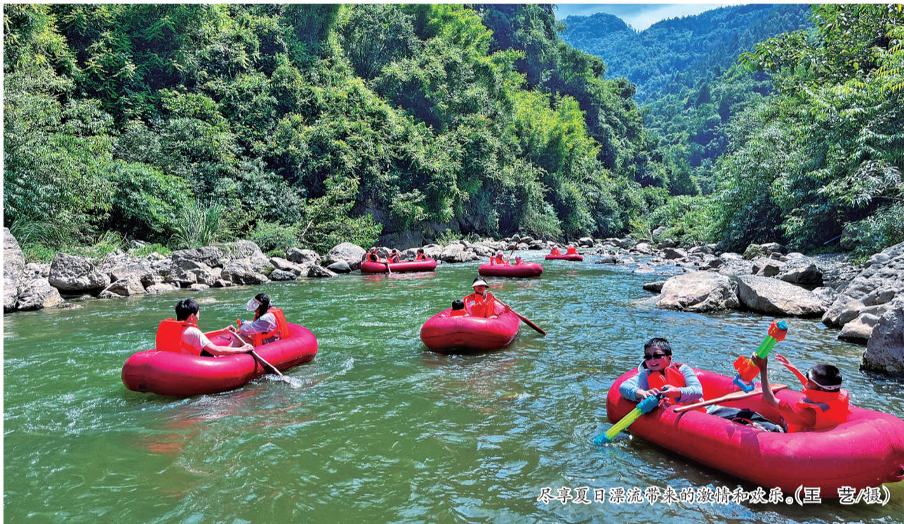
尽享夏日漂流带来的激情和凉爽。

据介绍,自今年7月1日仙女峡漂流景区开漂以来,目前已接待游客3万余人,随着高温天气的持续,景区也迎来漂流接待高峰期。