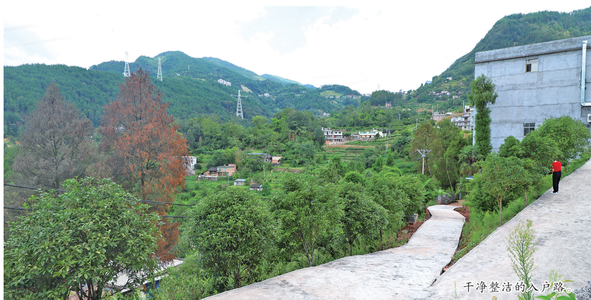
干净整洁的入户路。

原来，该项目按照群众参与、自下而上、公开比选、绩效评价的原则，以基础设施改造提升和综合环境整治为主要方向，由各乡镇（街道）集中推介申报拟纳入计划实施的民生项目，区发展改革委、财政局、住房城乡建委等相关部门组织区党代表、人大代表、政协委员、乡镇代表、有关专家和群众代表召开项目推介审查会，综合考虑项目成熟度、代表性和覆盖面等因素，对项目进行打分评定。按照分数高低排序，最终确定10个项目作为2023年武陵区竞争性民生项目。